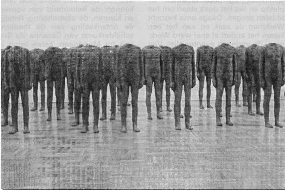
Magdalena Abakanowicz, Hurma, 1998