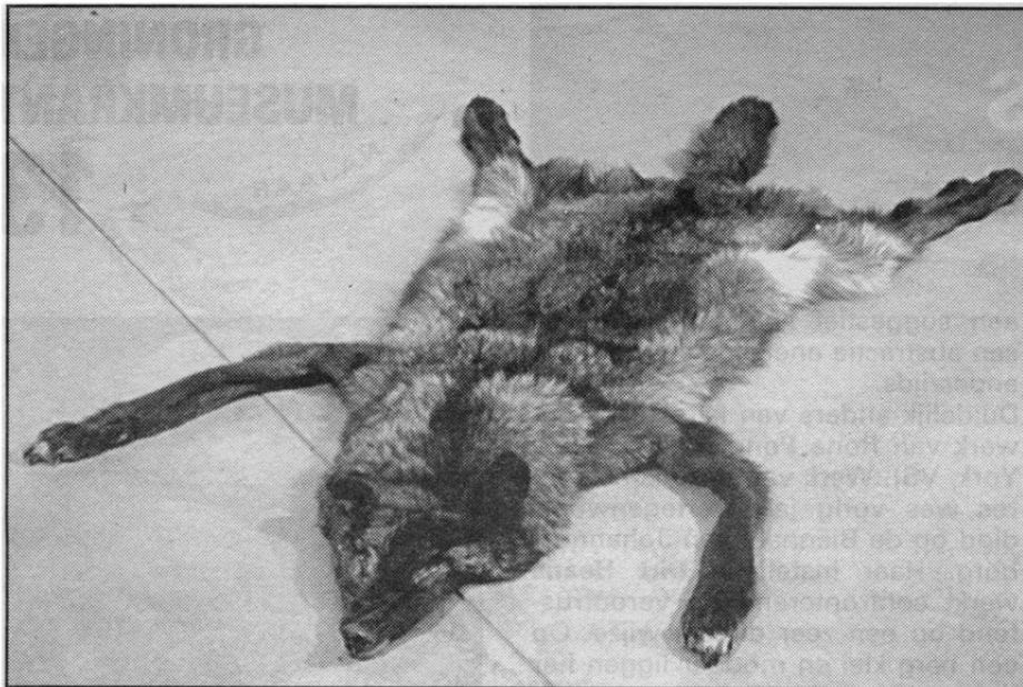
Zoe Leonard, Wolf with red eyes, 1997

accurate wijze demonteert hij de voorwerpen en assembleert deze vervolgens tot een kunstwerk. Een beroemd voorbeeld is de kinderwagen die hij demonteerde en die bleek te bestaan uit veertien verschillende materialen. Van deze materialen maakte Bolink vervolgens veertien nieuwe mini kinderwagentjes. Een symbool van voortplanting, de kinderwagen, heeft zich nu zelf voortgeplant en zichzelf tegelijkertijd opgeofferd. Het titelloze werk uit 1994 dat het Groninger Museum toont bestaat uit een zinken emmer en een antieke brandweerslang. Het is net alsof de brandweerslang de emmer heeft opgegeten, alsof een boaconstrictor een olifant heeft verorberd. Beide elementen versterken elkaars directe betekenis, maar door hun enigszins absurde structuur, heffen zij elkaars betekenis tegelijkertijd ook op en verworden de twee dingen tot een fantastisch geheel.