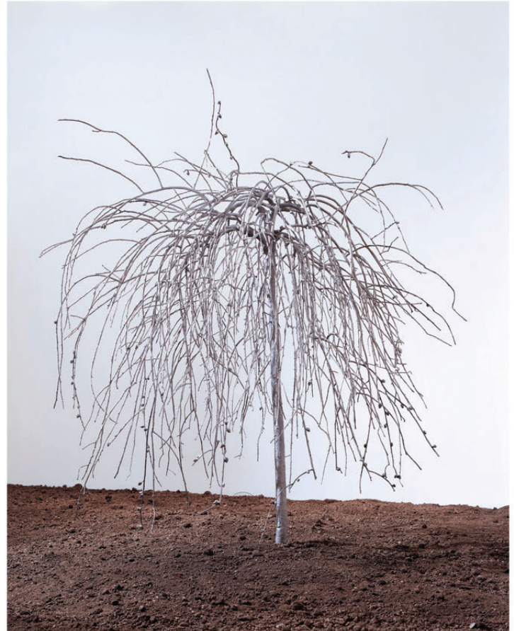
Boven: Rona Pondick, 'Pussy Willow Tree', 2001, roestvrij staal, afval, 69 x 62 x 57 inches, © Sonnabend New York. Foto: Lawrence Beck

De beelden van Rona Pondick zijn nog tot 12 jan 03 te zien in het Groninger Museum, Museumeland 1, Groningen, i: www.groninger-museum.nl