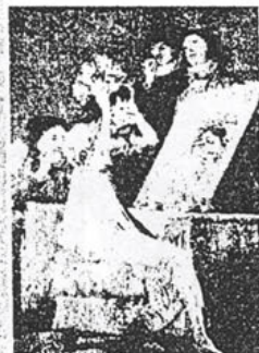
Ci-dessus, « Hasta la muerte », l'un des 80 Caprices de Goya. Ci-contre, « Fox », sculpture en acier de Rona Pondick, hybride monstrueux comme on en trouve chez Goya. En bas à gauche, l'une des photos sur toile de Yasuma Morimura. Ci-dessous, l'une des pièces de la série United Enemies de l'artiste Thomas Schütte, sorte de poupées d'incantation.